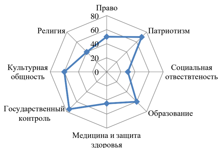
Диаграмма (лепестковая) превалирования и силы отдельных общественных институтов в России

Обоснуйте свое мнение по каждому институту в комментариях к диаграмме.