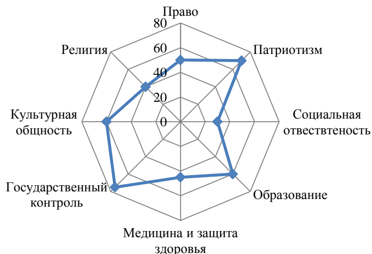
Диаграмма (лепестковая) превалирования и силы отдельных общественных институтов в России

Обоснуйте свое мнение по каждому институту в комментариях к диаграмме.