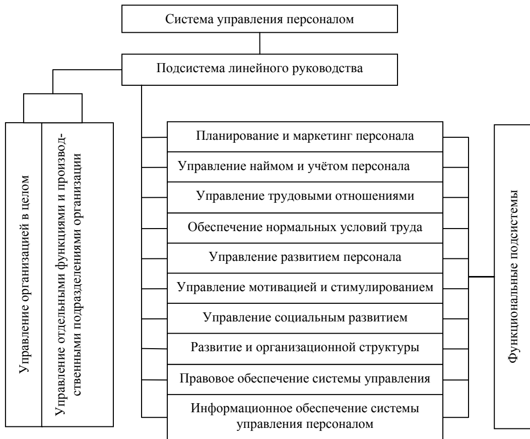
Рис.1. Состав подсистемы управления персоналом организации