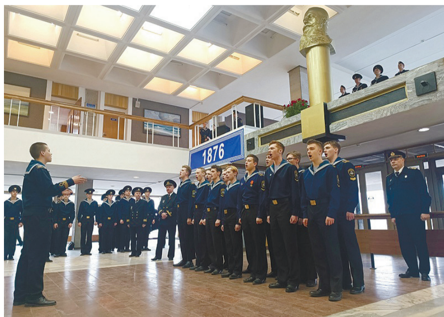
Центр патриотического воспитания управления внеучебной и воспитательной работы, структурные учебные подразделения, отдел маркетинга и связей с общественностью

В Котласском филиале с 8 по 12 апреля для обучающихся 1-го курса прошли встречи «Чтить память и помнить исто-