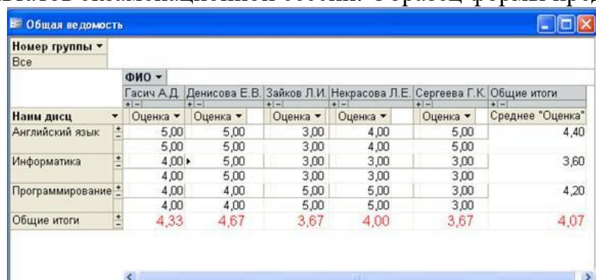
Рис. 6. Форма в виде сводной таблицы

Создайте форму в виде настраиваемой сводной таблицы для просмотра результатов экзаменационной сессии. Образец формы представлен на рис. 6.